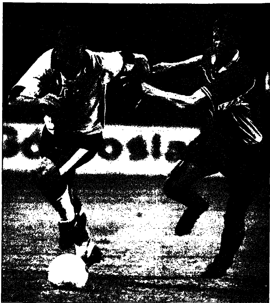
مارك غزويك لاعب بولندا (الي اليمين) ينافس آلان شيرار نجم انكلترا على الكرة

تشرورج - رويترز (بولندا) - ورويتز: التقت انكلترا من الصعود الى نهائيات كأس العالم لكرة القدم التي ستقام في فرنسا العام المقبل بفوزها على بولندا 2/1 صفر ضمن مباريات المجموعة الثانية بالتصفيات. واحرز آلان شيرار الهدف الاول في الدقيقة الخامسة ثم عزز الهدف الثاني في الدقيقة 17. وتفادى بولنديون ان يحرزوا هدفين في المباراة. ولم يسد البولنديون أي كرة على الرمي حتى الدقيقة 30 ولكن أقرب فرصة للتسجيل لاحت لبولندا في الدقيقة 42 عندما لعب غاسيك ميمبكي كرة قوية انقلتها غاريث ساوثجيت للدفاع الإنجليزي. واحتسبت سورية جزءا من انكلترا بعد ثلاث دقائق من بداية المباراة. وبعثت بولندا بكرة حرة في الدقيقة 50 عندما لعب غاسيك ميمبكي كرة قوية انقلتها غاريث ساوثجيت للدفاع الإنجليزي. واحتسبت سورية جزءا من انكلترا بعد ثلاث دقائق من بداية المباراة. وبعثت بولندا بكرة حرة في الدقيقة 50 عندما لعب غاسيك ميمبكي كرة قوية انقلتها غاريث ساوثجيت للدفاع الإنجليزي.